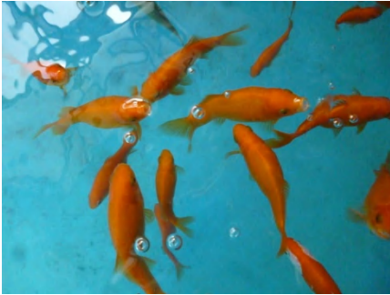
【 ワキン 】

十数尾から始めたグッピーの繁殖は順調で、約1年で800尾を超えました。また、オキアミを使った楊貴妃(メダカ)の色揚げにも成功しています。(活動報告No.21)