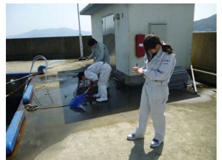
【 海洋栈橋魚類相調査 】