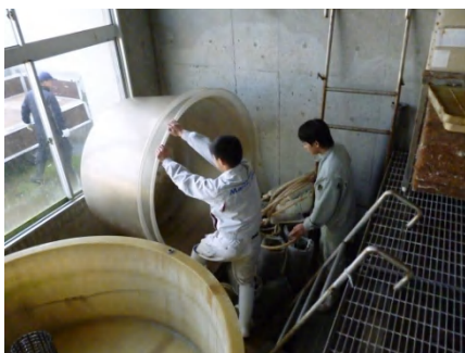
【 大掃除 】