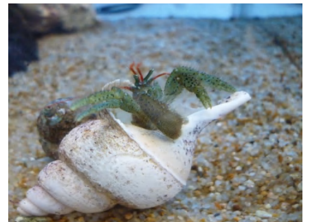
【 ケアシホンヤドカリ 】 殻が大き過ぎて重い…