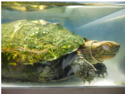
【 イシガメ 】 水中で日向ぼっこ