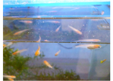
【 楊貴妃 】