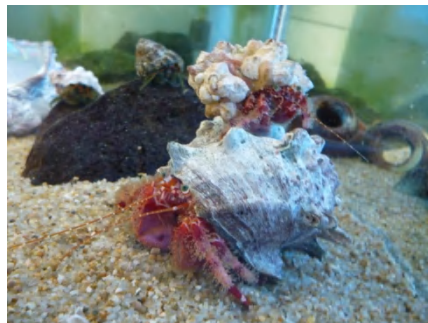
【 ベニホンヤドカリ 】 いつも仲良し