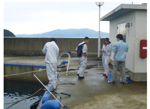
[ 海洋栈橋魚類相調査の様子 ]