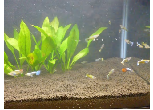
[ 展示用水槽設置 ]

「育てたグッピーをきれいに見たい!」ということで60cm水槽を購入しました。この水槽には、今年繁殖させたグッピーの中からきれいな個体を選抜して収容しました。繁殖だけではなく、レイアウトも勉強していきたいと思い、水槽には水草(アマゾンソード)も入れました。これから少しずつ水草も購入していく予定です。