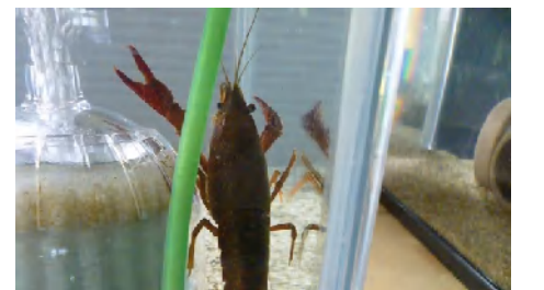
〔アメリカザリガニ〕

今年はメダカ、グッピーが順調に繁殖しています。アメリカザリガニはいつも成体を青に体色変化させてきましたが、今度は繁殖させ、生まれた時から体色変化をさせてみたいと思っています。