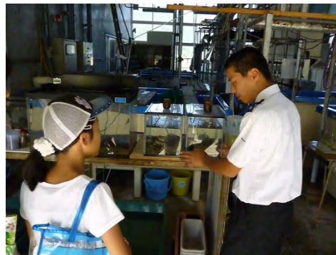
〔栽培漁業実習棟案内〕