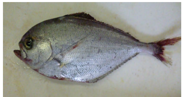
[ シマガツオ ]

魚類相調査中に、浜側で見慣れない魚を発見しました。上手く投網で捕獲することに成功し、調べてみると「シマガツオ(エチオピア)」でした。このような内湾の浅瀬で見られるとは思いませんでした。残念ながら翌日にはヒレが強クスレて死んでしまいました。