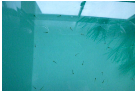
[ ワキンふ化仔魚 ]