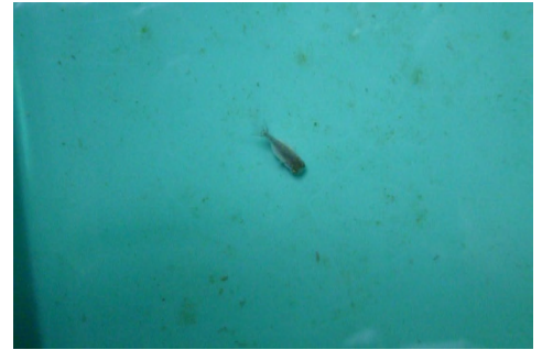
[ H23 ランチュウ ]