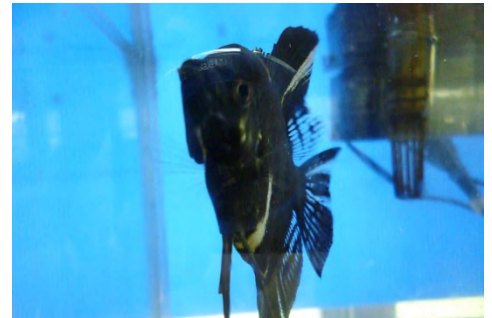
[ エンゼルフィッシュ ]