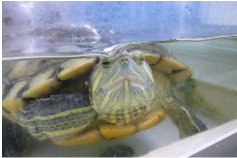
[ アカミミガメ ]