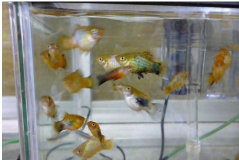
[ プラティ ]