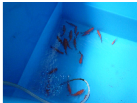
[ 採卵準備・水槽移動 ]