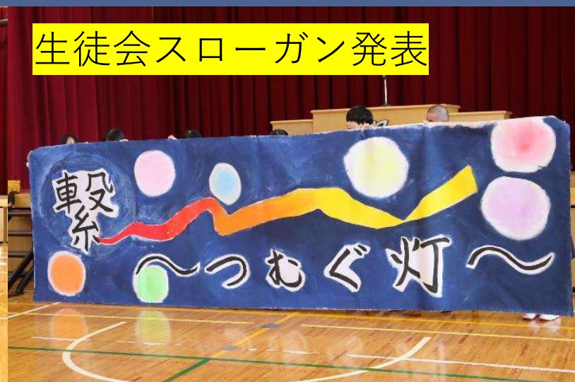
生徒会スローガン発表