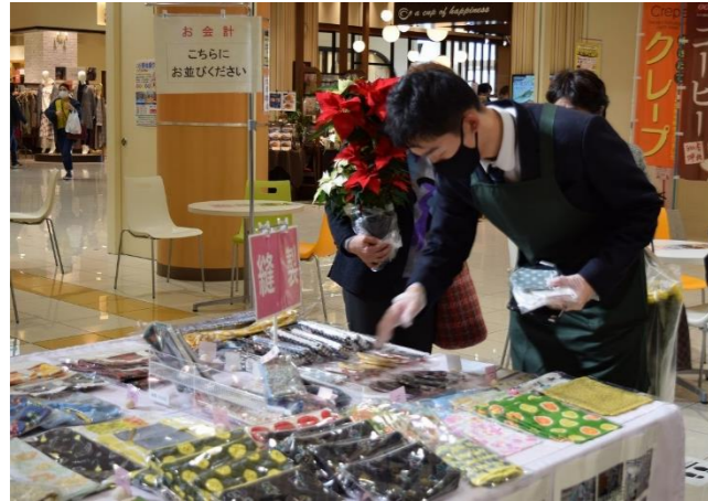
校外での販売学習