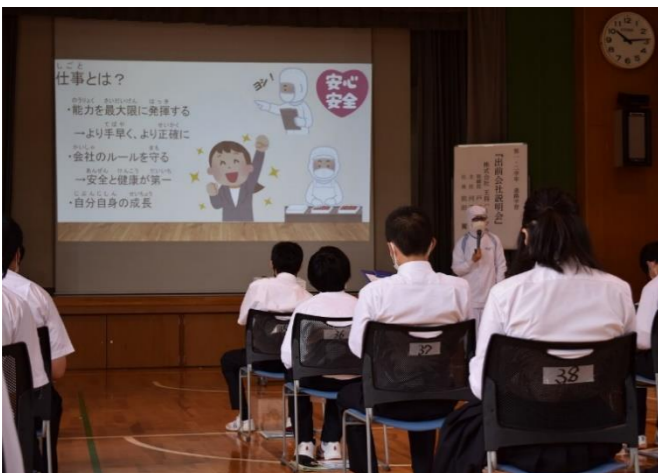
ビジネス家庭:OB 来校