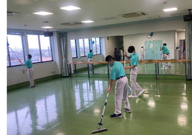
校外流通学習:近隣のコミュニティセンター清掃