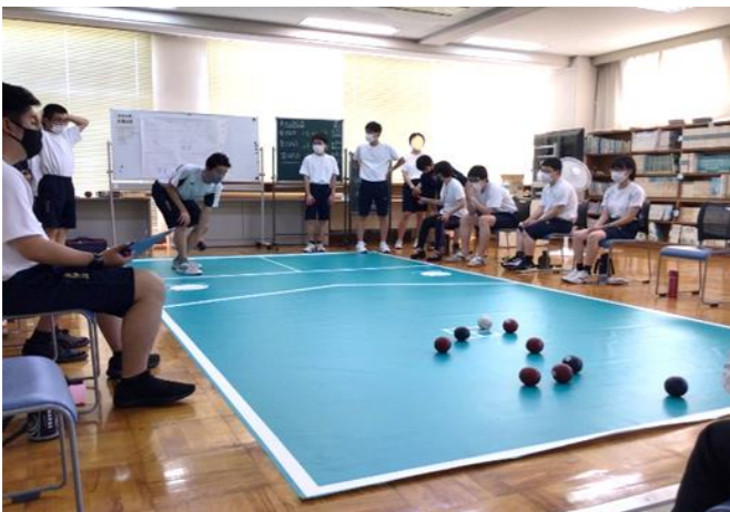
ビジネス総合科 ボッチャ大会