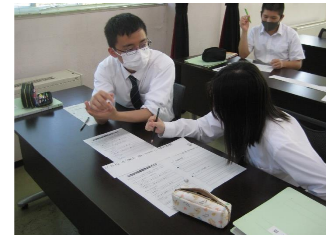
国語:交通安全啓発標語を考えよう