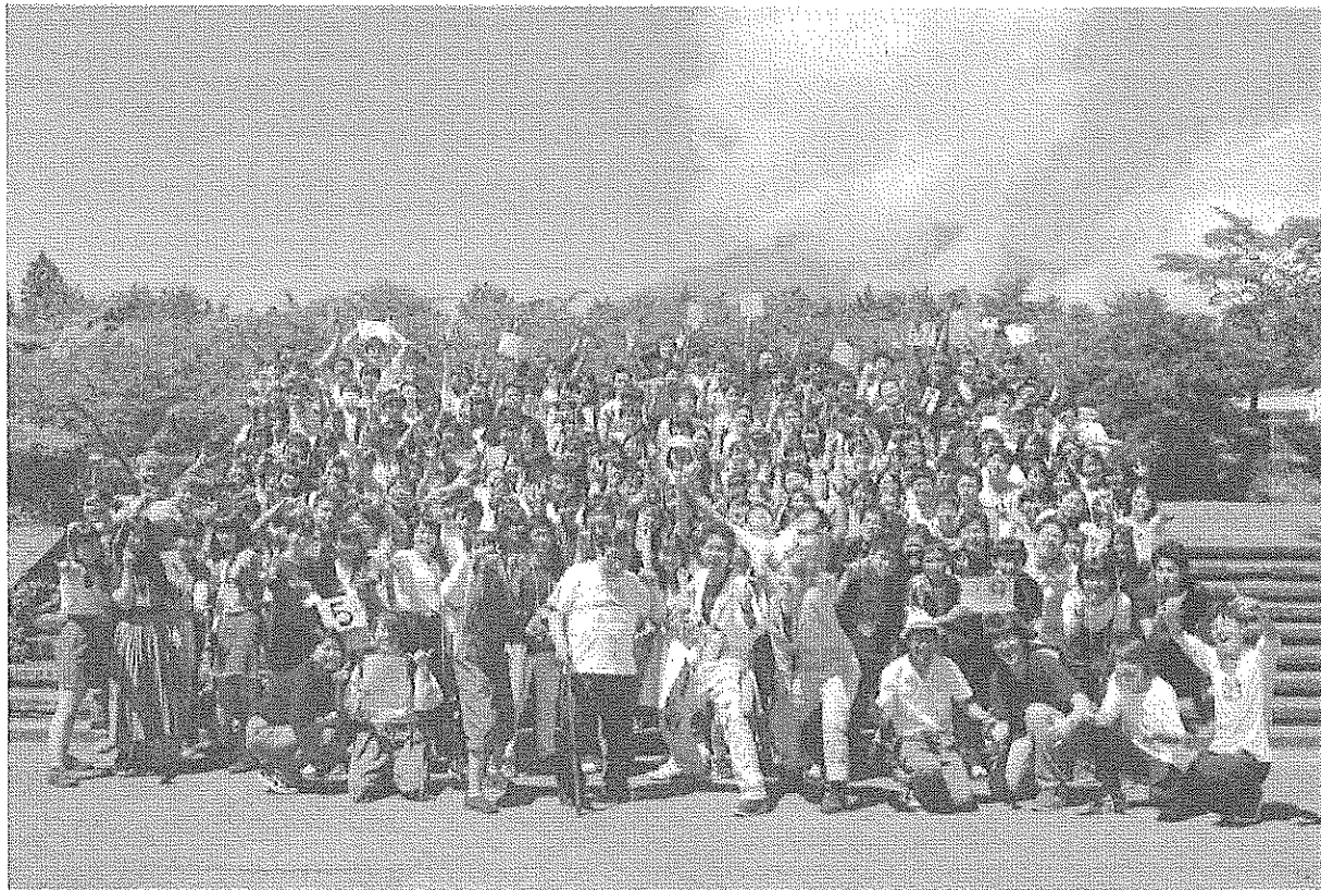
静岡県・中央のつどい

毎年夏休みに「つどい」という合宿行事を実施しています。高校奨学生の「つどい」は3泊4日の日程で、全国8会場で開催。大学・専門学校奨学生の初年度採用者を1か所に集めて行う「つどい」は4泊5日の日程で開催。有意義な学生生活を送るためにどうするかを考えてもらうため、卒業生や社会で活躍する著名人、海外の若者など多様な人材も招き、様々な刺激に触れる機会をつくっています。参加者の多くは「つどい」で夢を見つけ、一生の仲間を得たと言い、参加満足度は9割を超えています。