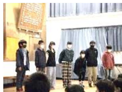
6年「修学旅行報告会」