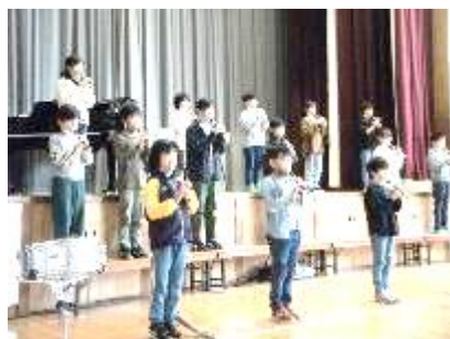
4年「オーラリー・茶色の小びん」