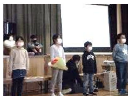
3年「私たちのじまんの町 石川」