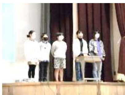
5年「コウノトリがつなぐ自然にやさしい米づくり」