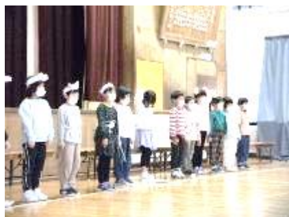
1年「おきにいの動物をしょうかいしよう」