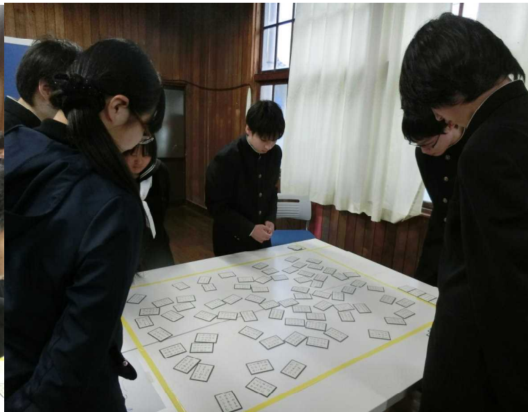
札を探しています。