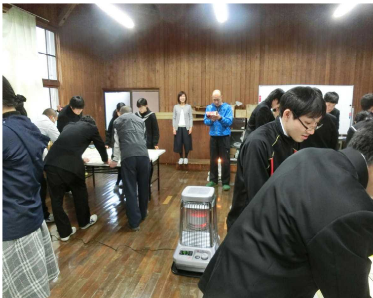
読み手は浪江先生でした。

1月18日（金）、校内百人一首大会をおこないました。1年生～3年生の21名+教員3名の計24名を3人1組の8チーム作り、各チームの総獲得枚数で勝敗を決めました。優勝は3年生のBチームでした。