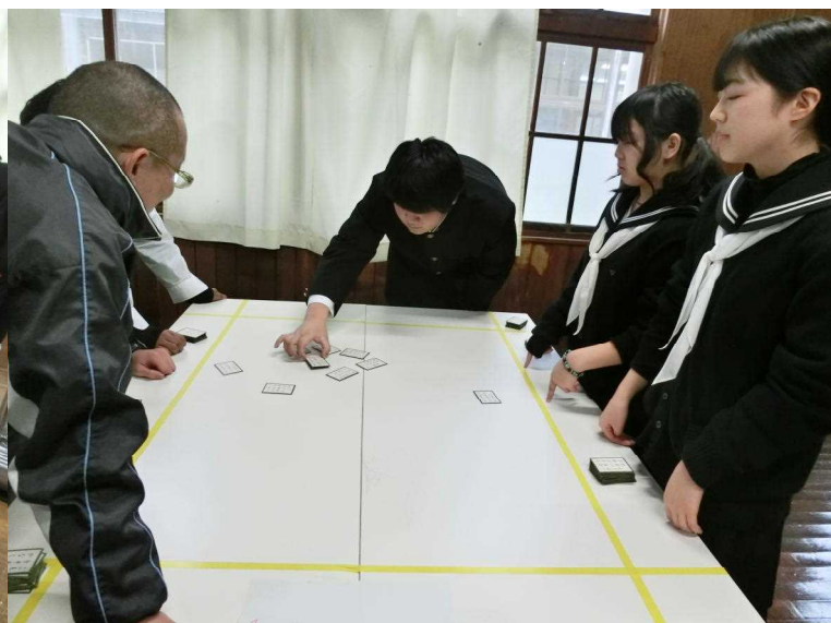
残りが少なくなっています