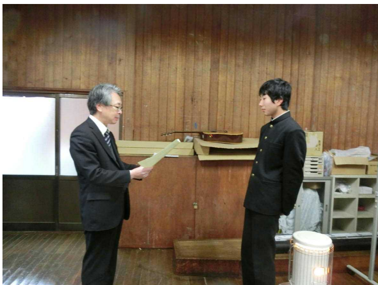
副校長より優勝チームを表彰