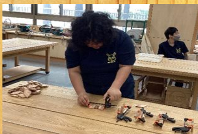
※コースターの組立をしている様子