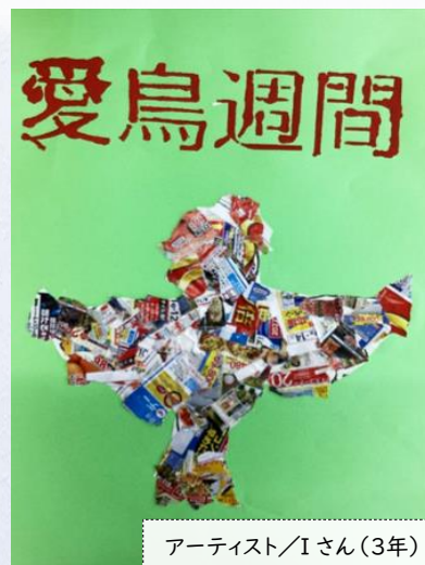
アーティスト/Iさん(3年)