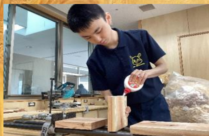
※木材にボンドを付けている様子

3年生が年間を通して作業学習「木工」に取り組んでいます。製材や磨き、組み立てなどの工程の一つひとつ大切に、気持ちを込めて製品づくりに励んでいます。本校で使用している木材は、井手町内の木材会社からいただいた端材を製材・加工し、材料づくりから行っています。完成した製品は、校内外の販売会やテオテラスいでに納品することを通して、保護者や地域の皆様にも購入していただくことができます。