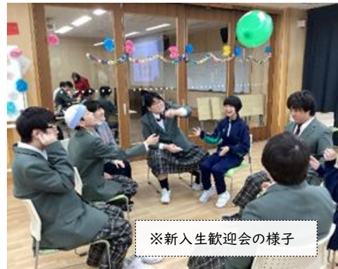
※新入生歓迎会の様子

高等部では、学級や学年を超えた様々な学習活動を通して、たくさんの人と関わりながら学習を進め、学力だけではなく、人と関わる力・余暇を楽しむ力等、卒業後必要な力を付けていきます。