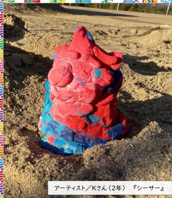
アーティスト/Kさん(2年) 『シーサー』