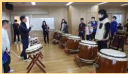
3年生はワークショップで課題曲に取り組みました。また、学部の代表としてお礼の花束を渡しました。