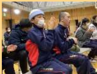
生演奏ならではの太鼓の響きを全身に感じて鑑賞しました。