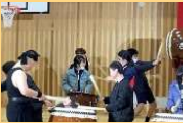
コラボ演奏では、中学部からは7名が参加しました。

1/29(月)30(火)に、上記事業による芸術鑑賞を全校で行いました。長崎県を拠点に全国で活動されている社会福祉法人南高愛隣会「瑞宝太鼓」様から6名の演奏者をお招きし、ワークショップ(3年生のみ)や鑑賞をしました。