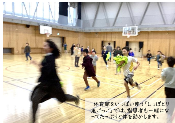
体育館をいっぱい使う「しっぽとり鬼ごっこ」では、指導者も一緒になってたっぷりと体を動かします。