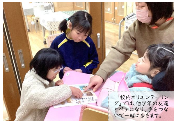
「校内オリエンテーリング」では、他学年の友達とペアになり、手をつないで一緒に歩きます。