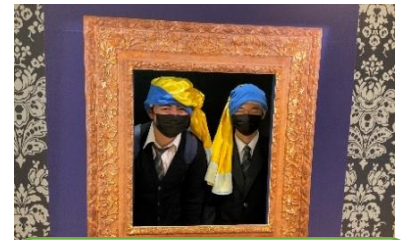
大塚国際美術館でフェルメールになってみました!!