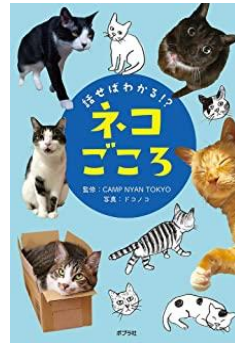
ネコちゃんの心、気持ちを 知って仲良くなりたいな