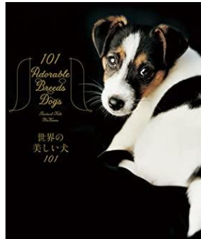
世界のいろんな犬を 見てみたい！