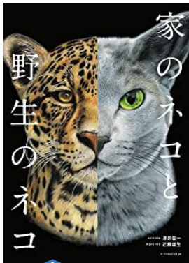
家の中の猫と野生の猫と どんなことが違うの？

この本↓表紙がとってもかっこよくないですか？表紙が見えるように本を置いているので、情報がたくさんある表紙から読んでみたいと思う本を見つけられることも多いのではないのでしょうか。