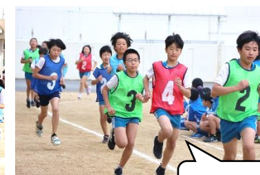
町内授業研究会のため