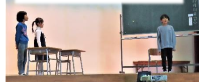
2・3年:劇 十二支のはじまり