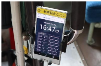
この機器にカードをかざします

ーそんな寄附をしてくださる方がいたことは知りませんでした。寄附をありがとうございます。運行協力金だけでは資金が足りないと思ったので、もっと乗る人を増やさないといけなくてですね。（詳しくはホームページを御覧ください）