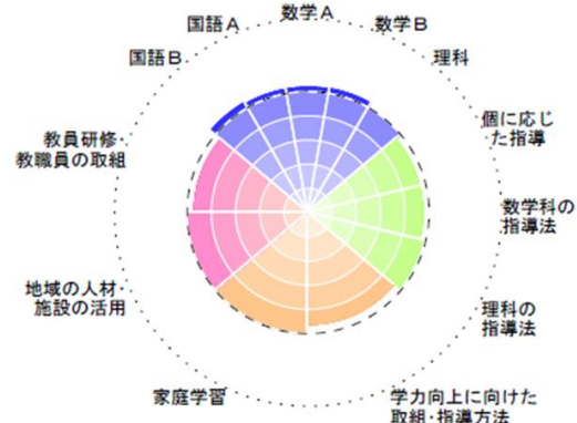
結果チャート(内側の点線が全国平均)

結果チャートに示された京都府(京都市を除く)の傾向を、この領域ごとに次ページから見ていきます。