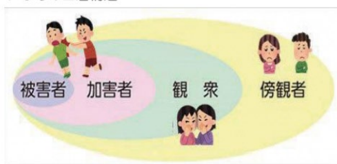
いじめの四層構造

被害者：いじめられている者 加害者：いじめている者 観衆：はやし立てたり面白がったりする周りの者 傍観者：見て見ぬふりをしたりおびえている周りの者