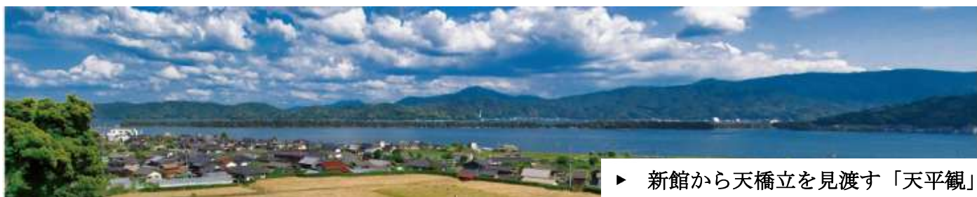
▶ 新館から天橋立を見渡す「天平観」