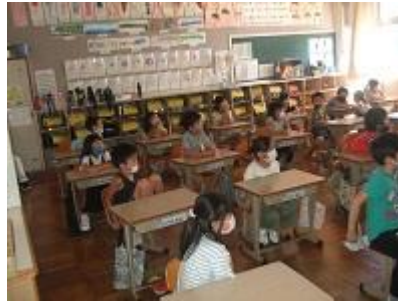
1年生、算数で長さの学習をしています。テープを使って長さを比べています。