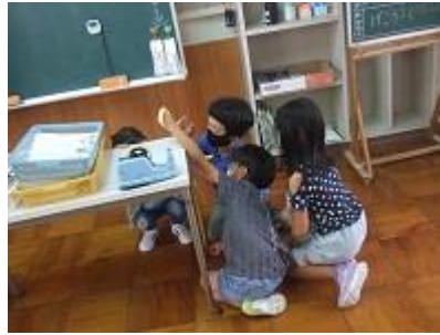
2年生、図工の時間に粘土で「こんにちは、むじゅたん」の学習です。ひねったり、つまんだりして形を作ります。