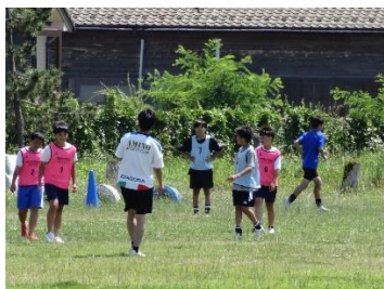
部活動体験「サッカー」

中学校での生活が待ち遠しくなった人も、多くいたのではないかと思います。あっという間の体験活動となりました。