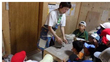
2年：生活科「校区探検」