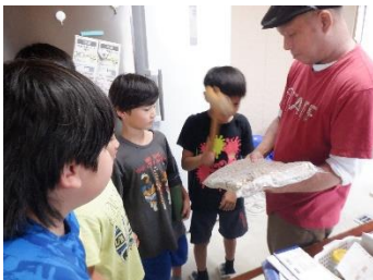
3年：総合的な学習の時間 「地域の名人」