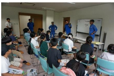
4年：社会科「浄化センター見学」

6月は、4年生の浄化センターの見学、3年生の図書館の見学、2年生の校区探検など地域の方にお話を聞き、学びを深めることができました。引き続き地域の中で、たくさんの経験、学びを深めていきたいと考えています。地域でご活躍されている方、子どもたちの学びにお力を貸していただける方など、ぜひ、ご紹介ください。よろしくお祈りします。