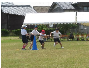
【児童会種目：台風の日】