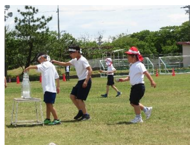
【児童会種目：満水リレー】