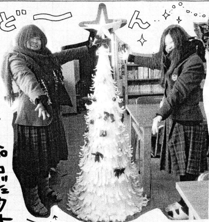
このツリーは 星の制作者