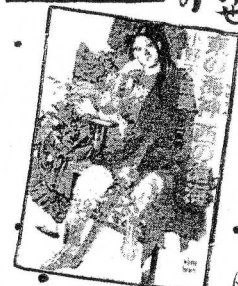
少し前に映画化されました。