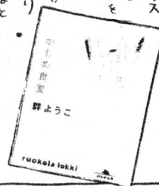
回書にこの本の原作のマンガも載っています。

● 最近のはかめ食堂が心に残る一冊です。こだわりを持って生きている感じが食べ物が食べてみたい