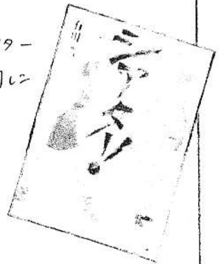
『シアター』 有川浩 著

人気はあるのにお金がたない!? 解散の危機が迫る小唄團「シアターフラック」の主宰。香川巧は只の司に借金せして唄團の未来を繋ぐ。果してどうなるか...!? 『図書館戦争』でおなじみ有川浩さんの作品です。