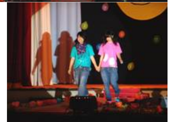
写真は上段左は3年（被服コース）、右は3年（ワンピース） 中段左は3年（甚平）、右は3年（着物） 下段左は2年（浴衣）、右は1年（絞り染めTシャツ）