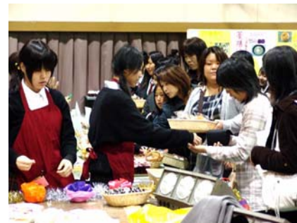
家政科のフードショップ 「まごころ王国」→