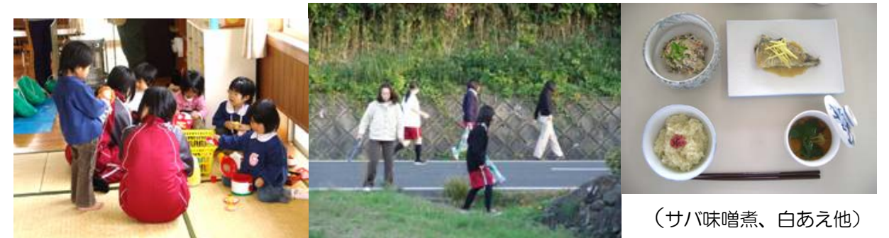
(サバ味噌煮、白あえ他)