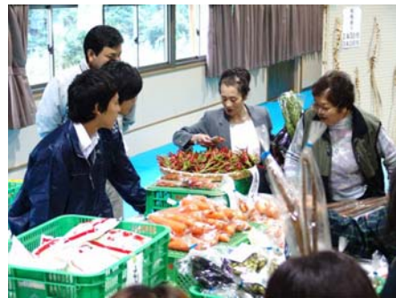
←農園芸科の農産物即売

10月26日(日)に平成20年度の奈具丘祭が開催しました。PTA 会員の皆様も多数参加され、PTA ショップ（ラーメンなどの販売）やバザーで奈具丘祭を盛り上げていただきました。今回の成功で生徒達もさらに大きく成長してくれたことと思います。