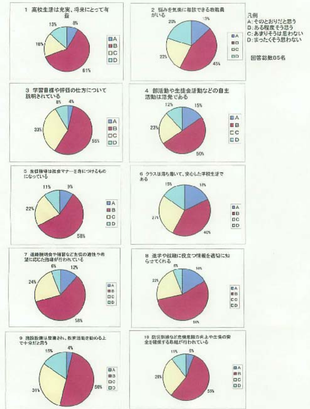
〔資料2〕 峰山高校の教育活動に関するアンケート(生徒用) 〔弥栄分校〕 平成19年11月実施