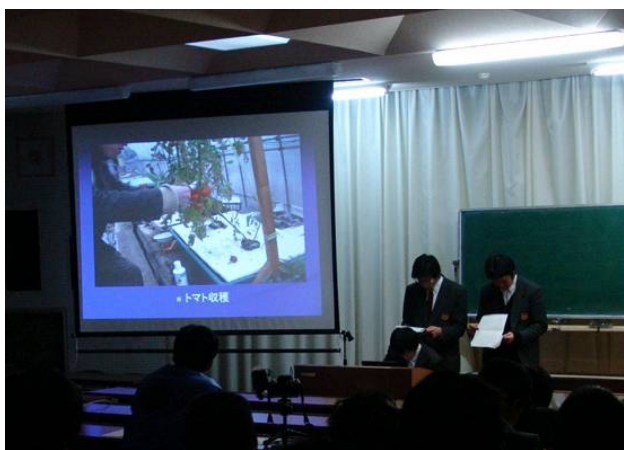
農園芸科の発表の様子↑