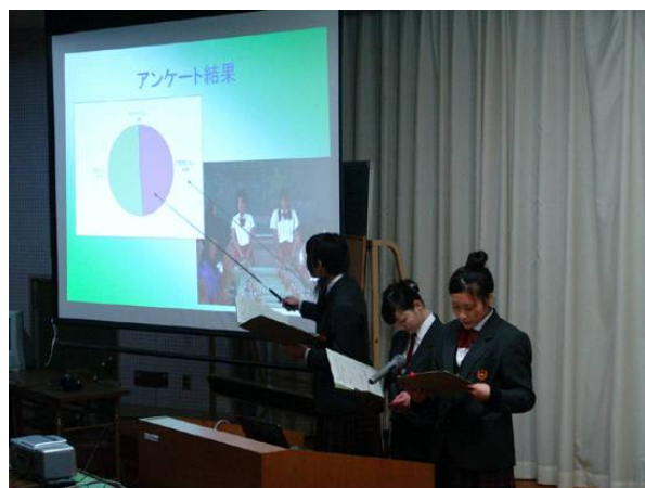
家政科の発表の様子↑

それぞれの学科とも、パワーポイントや実物を示しながらの発表で、緊張の中にも充実した発表が続きました。