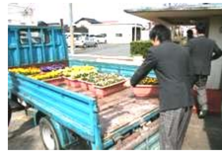
トラックで運びます