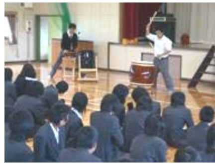
クラブ紹介(和太鼓部)

5月2日(水)には、生徒総会や農業クラブ総会(農園芸科の生徒は全員農業クラブ員として、全国の農業系学科で学ぶ高校生と交流をします)や家庭クラブ(家政科の生徒は全員家庭クラブ員として活動します)の総会がおこなわれました。