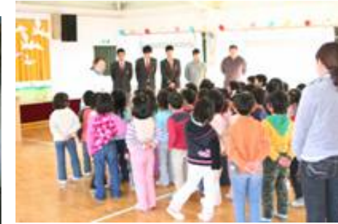
幼稚園児へのあいさつと説明

世代間交流で網野幼稚園との交流をしています。3月には育てた花を植えたプランターを持って、卒園式前に訪問しました。育てた花は、大事に活用されていると思います。