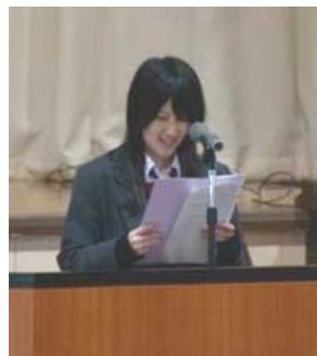
挨拶する系井生徒会長