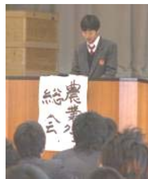
挨拶する堀江農業クラブ会長