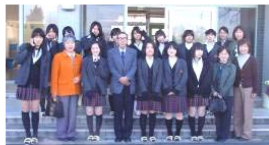
玄関前で一緒に記念撮影！