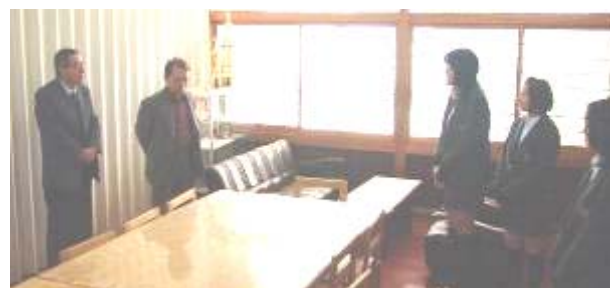
応接室で感謝の言葉をいただきました