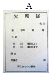
欠席（一日休みの場合）