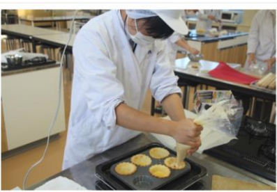
スイーツ講習会 上段 第1回：10月1日（木） 下段 第2回：10月15日（木）