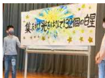
【児童集会でのスローガン発表の様子】