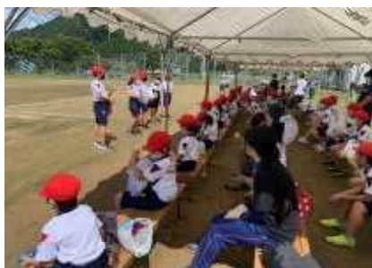
【赤組・白組の解団式の様子→】