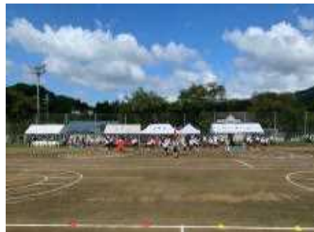
【←代表委員会児童による開会挨拶 団長の選手宣誓】