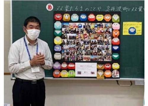
【東日本大震災についての講演】

お話していただいたことを基にして、各自が調べたい課題を決めての防災学習がスタートしました。