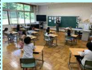
【2年生外国語の授業の様子】