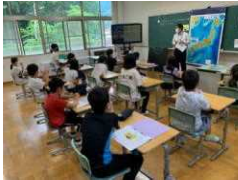
【5年生教室での授業の様子】

5年生は総合的な学習の時間で「防災学習」に取り組んでいます。6月17日（木）には、京丹波町CATVの方を招いて、東日本大震災の取材で経験したことや感じたことを語っていただきました。