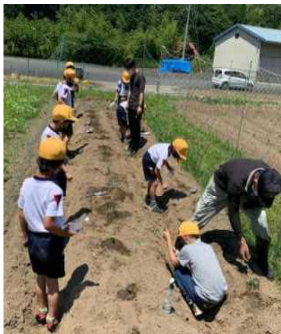
【↑丹波黒大豆を植える3年生】

「元気が一番」の和知小学校です。食べ物のすばらしさや大切さを知って、しっかり食べて、これからも元気いっぱいの子どもたちでいてほしいと思ひます。