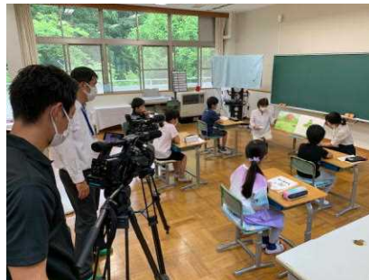
【4年生教室での読み聞かせ】