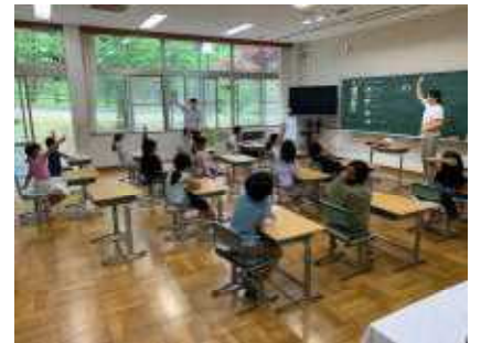
【1年生教室での授業】

「元気が一番」の和知小学校です。食べ物のすばらしさや大切さを知って、しっかり食べて、これからも元気いっぱいの子どもたちでいてほしいと思ひます。