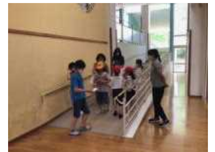
【全校遊び「宝さがし」の様子】