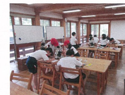
プランクトン・海藻観察