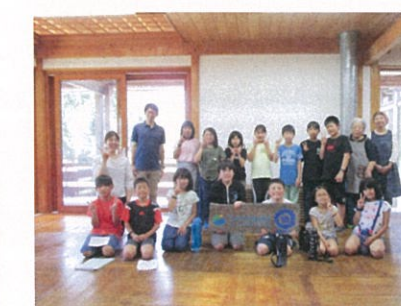
施設のスタッフの皆さんと