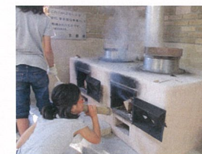
おくどさん体験 カレー作り