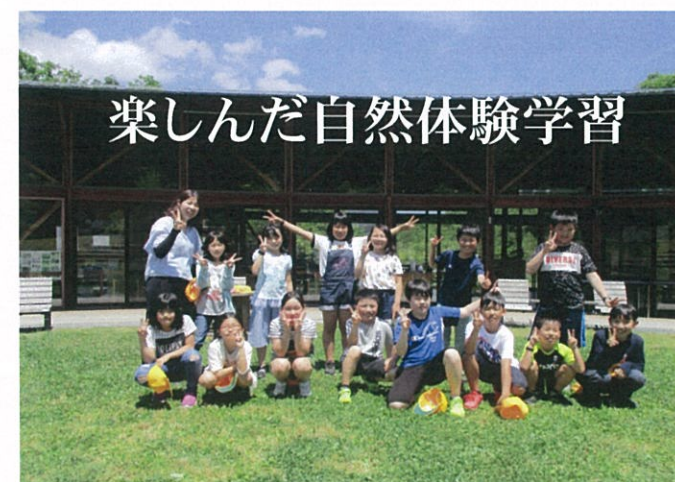
楽しんだ自然体験学習