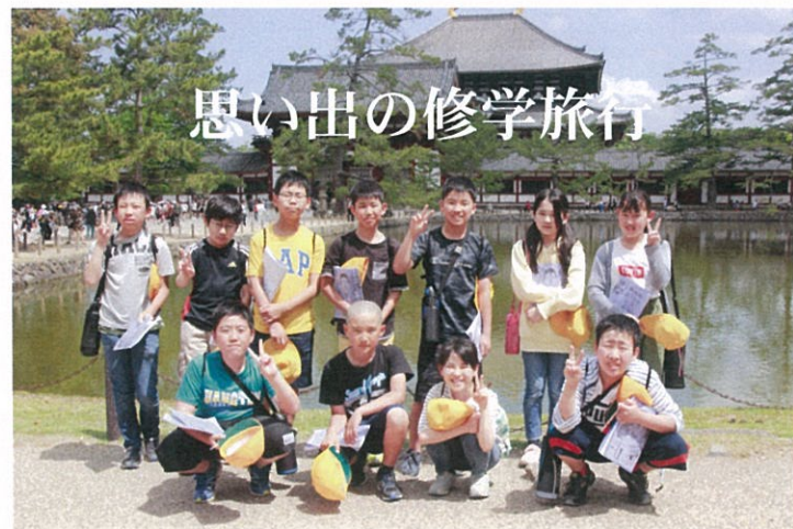
思い出の修学旅行