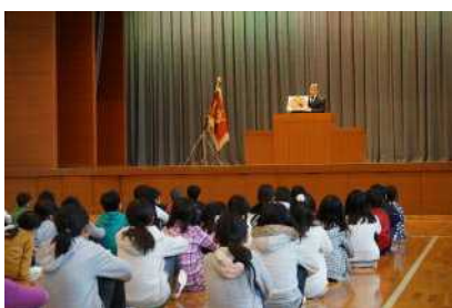
3学期始業式の様子