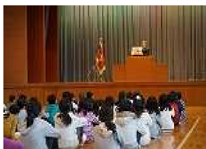
3学期始業式の様子