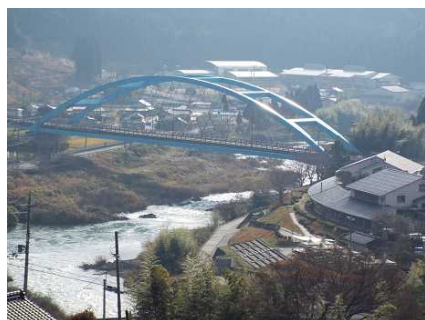
1月2日 穏やかな和知の風情