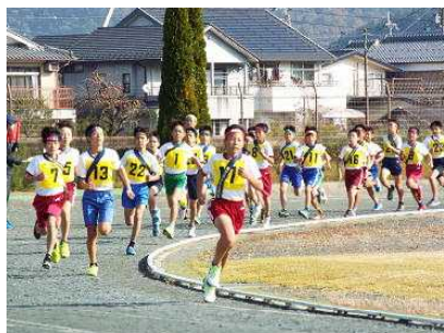
力走する各チーム1区の選手達 ～和知小Aは、1区で区間賞～

私は、今年も本部の副会長として大会の運営に係わることになりました。その中での3つの大きな感動を紹介します。1つ目の感動は、選手みんなが、『襷』に思いをつなげて、チームの総合記録を1秒でも縮めようと力走する姿に感動しました。学校再編により新しくなった小学校は、この駅伝を通して絆が高まりました。2つ目の感動は、来賓・保護者からの声援と役員の皆様方の協力です。来賓・保護者のみなさんの声援が選手の中を押ししました。また、各校の役員のおかげで安全に開催できました。3つ目の感動は、駅伝の種目と会場です。この駅伝という種目は、京都が発祥の地であり、なんと1917年から100年も続いています。この素晴らしい競技を、そして駅伝を行うことができた会場である陸上競技場に感動しました。当たり前のことかもしれませんが、大会の運営に係わる中で当たり前のように感謝する気持ちが出てきました。子ども達が駅伝という競技を通して、共に競い合い高め合うことができたことを喜びに感じています。