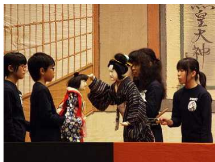
町文化祭で出演「…おぼえのある ひたいのほくろ、やし、わがふ…」

さて、11月6日に京丹波町文化祭が和知ふれあいセンターで開催され、人形浄瑠璃クラブのみんなが大活躍をしました。和知小学校の伝統をしっかり受け継いでいることを本当に嬉しく思います。和知人形浄瑠璃は、京都府無形民俗文化財に指定されており、保存会の皆様の絶大な支えでステージ発表が大成功に終わりました。歴史と文化を継承する子ども達は、見事に演じ切りました。さすが和知の子です。