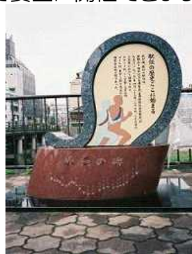
京都・三条大橋付近 にある駅伝の石碑

今、和知小全校児童が朝の体力づくりや、希望する4・5・6年が放課後チャレンジタイムで目標をもって走力を高めています。その成果を19日の南丹地区小学校駅伝競走大会(京都丹波キッズふれあい駅伝)、22日の校内持久走大会において、出しきってほしいと願っています。