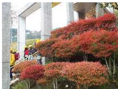
晩秋を迎えたドウダンツツジ

先日、和知小グラウンドの落ち葉が木枯らしに吹かれて、あたかも小人達が踊っているように見えました。また、校門前の「ドウダンツツジ」が燃えるような紅色になり、晩秋の装いをしてきました。いよいよ和知の地域にも本格的な寒さがやってきます。