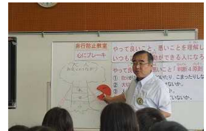
大切な人をがっかりさせない 非行防止教室での学び