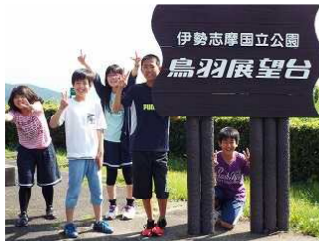
二日目の朝、気持ちのよい散歩