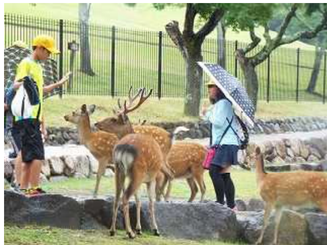
天然記念物の鹿とたわむれる

小学校生活の思い出といえば、修学旅行ですね。1日目は雨。二日目は快晴でした。そんな中、和知小の子どもたちは、大いに楽しみながらも、見聞を広め、学習としても充実した素晴らしい二日間となりました。