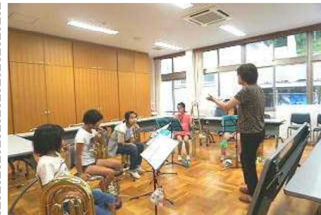
新しい講師を迎えた金管バンド