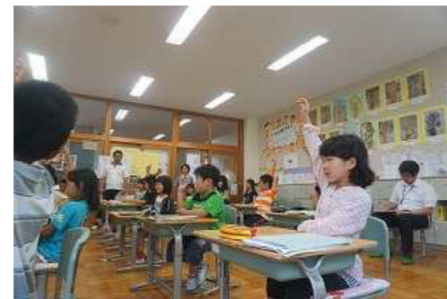
しっかり聞き、はっきり発言。元気が一番の和知の子の授業風景