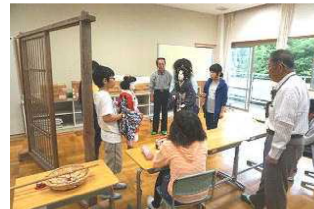
これぞ伝統文化 人形浄瑠璃

和知小の児童数も年々減少し、今年も93名、4年生以上は45名です。少人数でも伝統文化を受け継いでがんばっています。