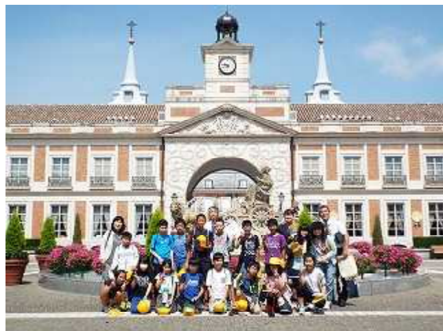
楽しみの志摩スペイン村