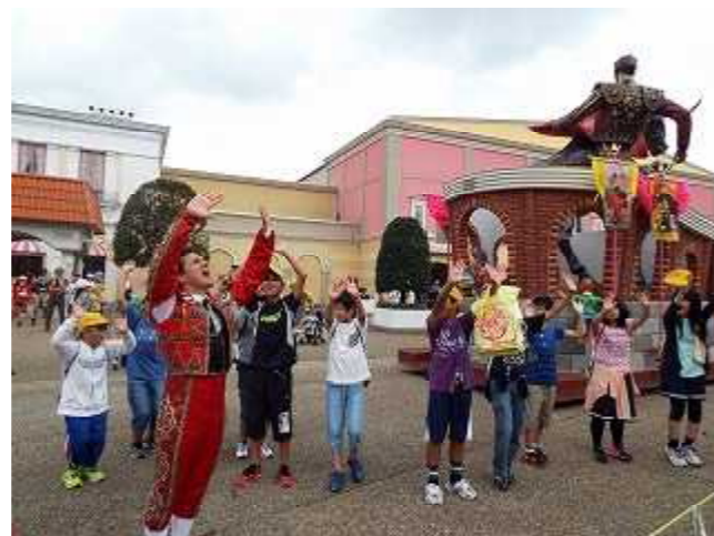
パレードに参加し盛り上がったダンス