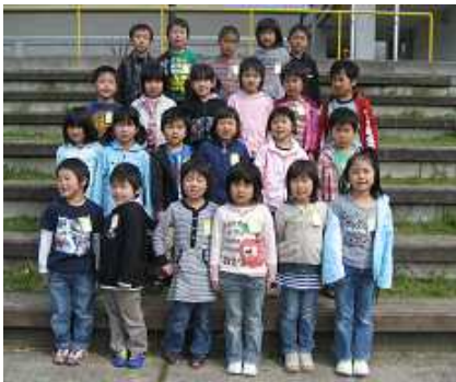
平成22年4月 入学したばかりの かわいい1年生