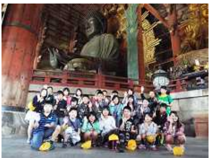
平成27年5月 修学旅行大仏ポーズ