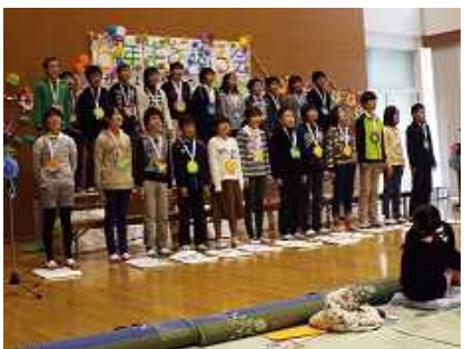
平成28年2月6年生送る会で

3月23日に、伝統ある和知小学校を巣立つ25名の皆さんの卒業証書授与式を挙行します。この1年間、最高学年として上記学級目標のもと