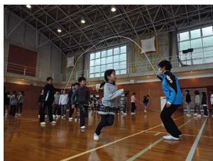
異年齢集団での8の字跳び