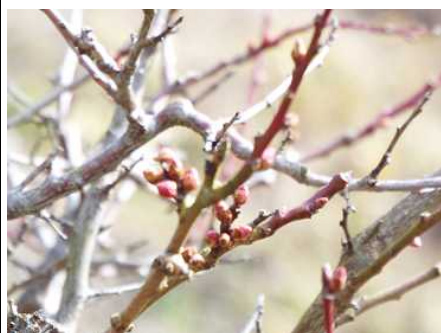
春の足音が聞こえます

2月4日の立春が過ぎると少しずつ寒さが緩み始め、春を感じる季節になってきました。和知小の校庭にある梅のつぼみの膨みや鳥のさえずりが聞こえ出しました。ふと、裏山のアスレチックで発見したふきのとうが『こんにちは』と小さな声で挨拶してくれました。