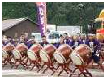
和知太鼓クラブ29人による 息の合った見事な演奏