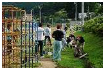
▲グラウンド周り溝そうじ