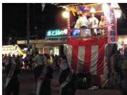
JR和知駅前での 二重三重の輪が広がった文七踊り