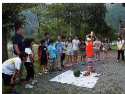
下川小児童との交流会で 西瓜割り