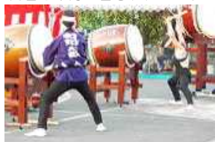
▲和知太鼓保存会の皆様の演奏