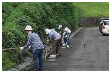
▲校舎裏山手側溝そうじ