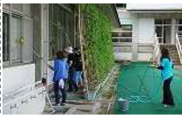
▲校舎のガラス拭き