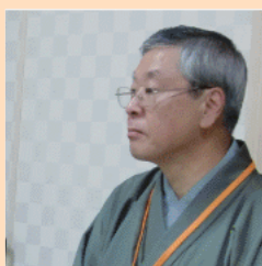
やぶのうちのえんなん 財団法人 藪内燕庵