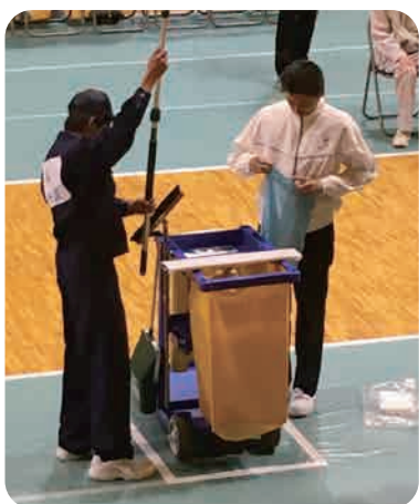
清掃検定（丹波支援学校）