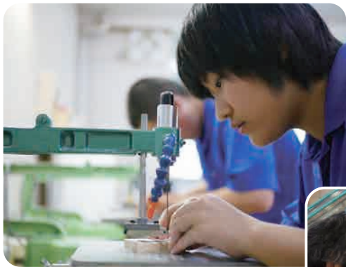
作業学習（城陽支援学校）

企業等における実習や作業学習などの体験を通して働くことの意義や喜びを知り、自立への意欲や人と接する態度を育むよう指導を進めています。