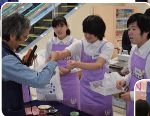
地域での販売学習（宇治支援学校）