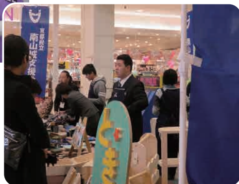
作業学習「ときめきショップ」（南山城支援学校）