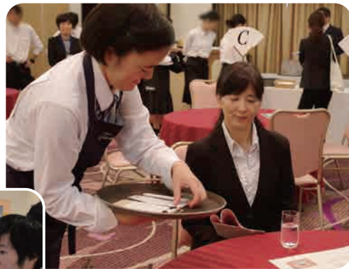
接客検定（丹波支援学校）