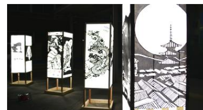
文化祭 [模擬店・展示作品]