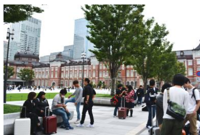
修学旅行(東京方面)