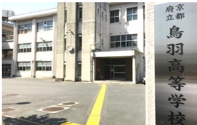
生徒数（令和2年5月1日現在）