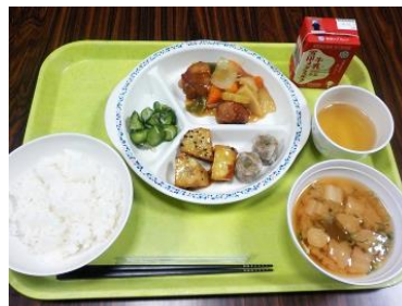
毎日バランスの良い給食