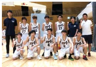
陸上競技男子 800m/1500m ・ バスケットボール男子

◆近鉄東寺駅から徒歩8分 鳥羽定へは、国道1号線側東門からお入りください。 学校見学は随時受け付けています ので、気軽に御連絡ください。 TEL 075-672-8481