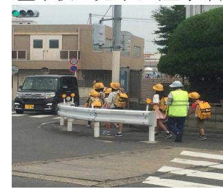
登下校の見守り(全学年)