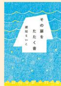
その扉をたたく音 集英社 1,540円(税込)