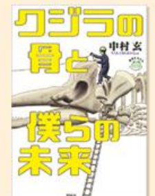
クジラの骨と僕らの未来 理論社 1,430円(税込)