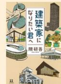
建築家になりたい君へ 河出書房新社 1,540円(税込)